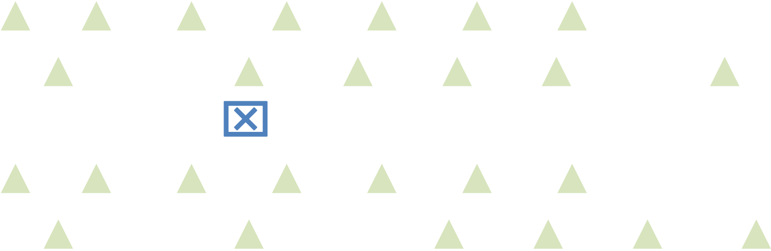
Fig.2 : formation en déploiement